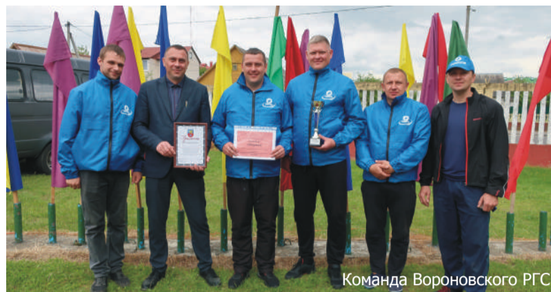
Команда Вороновского РГС

Команда ПУ «Гродногаз» стала бронзовым призером финала областного турнира на лучшую пожарную дружину Гродненской области.