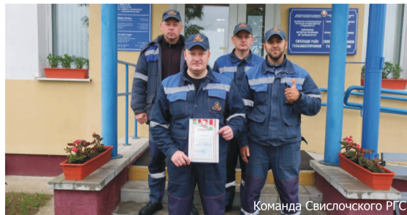
Команда Свислочского РГС