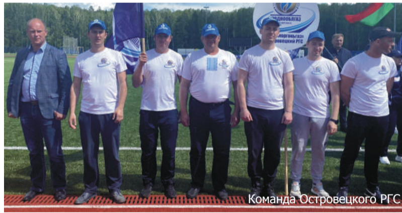
Команда Островецкого РГС