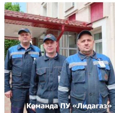
Команда ПУ «Лидагаз»

В мае-июне текущего года прошел очередной смотр-конкурс профессионального мастерства на звание «Лучшая бригада УП «Гроднооблгаз» по техническому обслуживанию ГРП». В защиту своих филиалов выступили 18 бригад в первом этапе смотра-конкурса. Для участия во втором этапе, из них было отобрано только 5 бригад, которые представляли свои производственные управления.