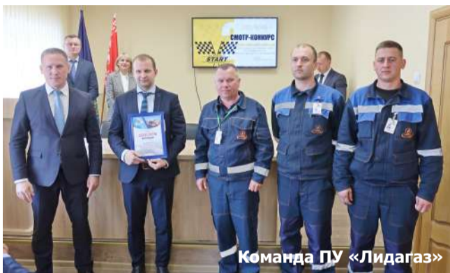
Команда ПУ «Лидагаз»