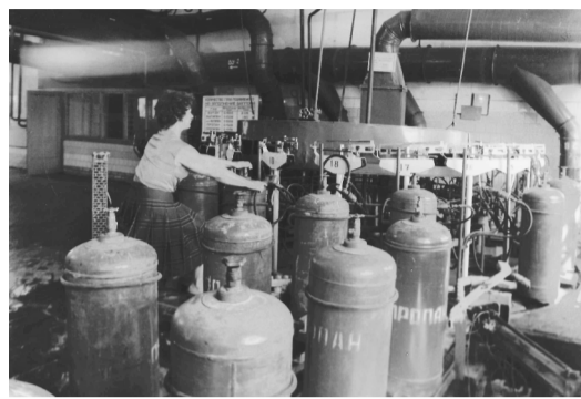
Установка наполнения баллонов УНБ-50, 1985

Продолжение о современном этапе развития Лидской ГНС читайте в следующем номере.