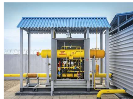
Пример одоризационной установки

ДЛЯ СПРАВКИ: Допускается подача неодорированного газа для производственных установок промышленных предприятий и электростанций по согласованию с Госпромнадзором и газоснабжающей организацией при непосредственном подключении к магистральному газопроводу или ГРС и при условии установки у них автоматических сигнализаторов загазованности в соответствии с нормативной документацией. Например, в Гродненской области есть два таких потребителя: это ОАО «Гродно Азот», который использует неодорированный газ в качестве сырья для производства продукции (аммиак, метанол), а также ОАО «Красносельскстройматериалы», использующий не одорированный газ как топливо для выработки электроэнергии на технологические нужды.