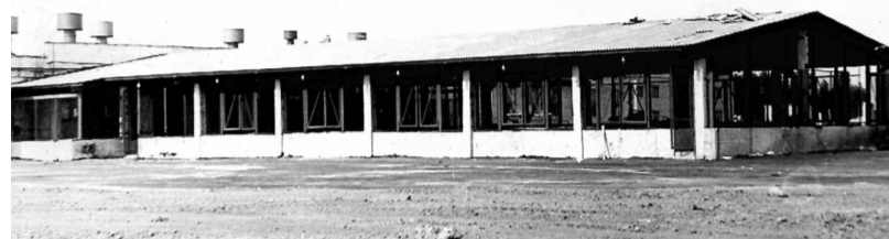
Рампа хранения баллонов, 1975