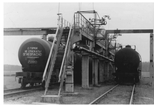
Железнодорожная эстакада слива СУГ, 1985