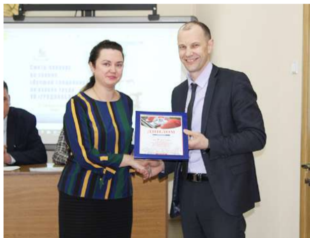
27 марта 2019 года на базе ПУ «Лидагаз» был проведен смотр-конкурс «Лучший специалист по охране труда УП «Гроднооблгаз» - 2018».