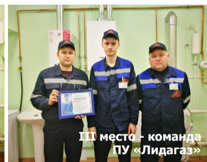
III место - команда ПУ «Лидагаз»