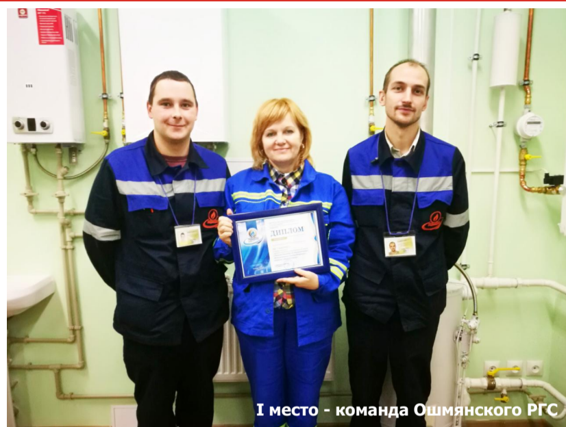
I место - команда Ошмянского РГС