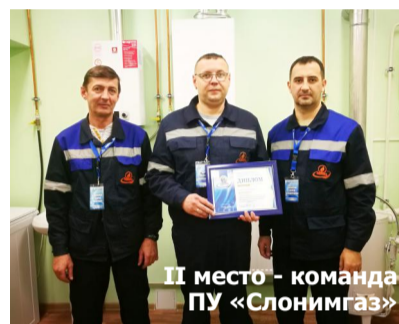
II место - команда ПУ «Слонимгаз»