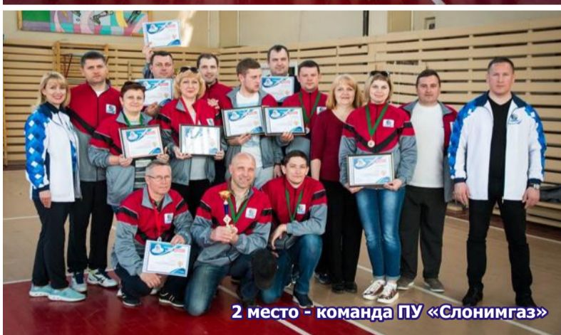
2 место - команда ПУ «Слонимгаз»