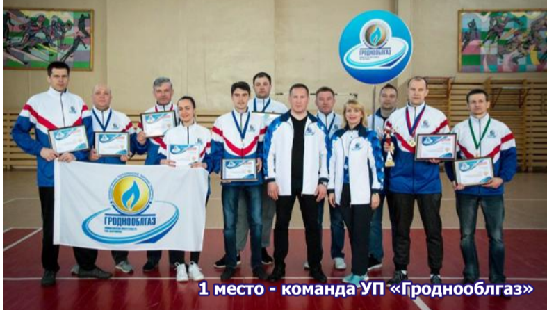
1 место - команда УП «Гроднооблгаз»