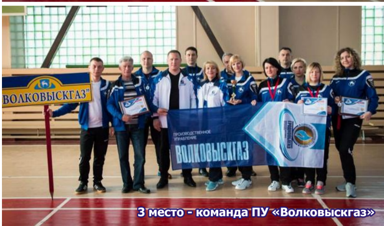
3 место - команда ПУ «Волковыскгаз»