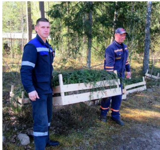
СПУ «Протасовщина» - посажено 5 300 саженцев на площади 1 га