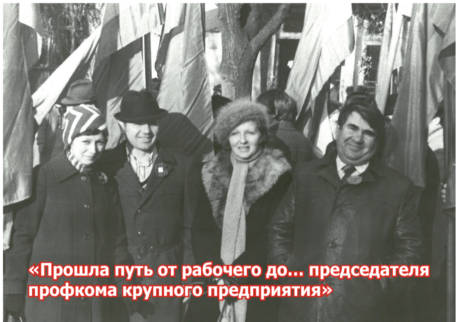
«Прошла путь от рабочего до... председателя профкома крупного предприятия»