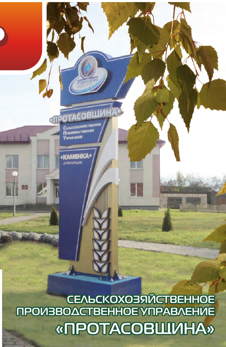
СЕЛЬСКОХОЗЯЙСТВЕННОЕ ПРОИЗВОДСТВЕННОЕ УПРАВЛЕНИЕ «ПРОТАСОВЩИНА»

уверенность, что и в дальнейшем работники сельскохозяйственного производства будут приумножать достигнутое, работать с полной отдачей на благо страны.