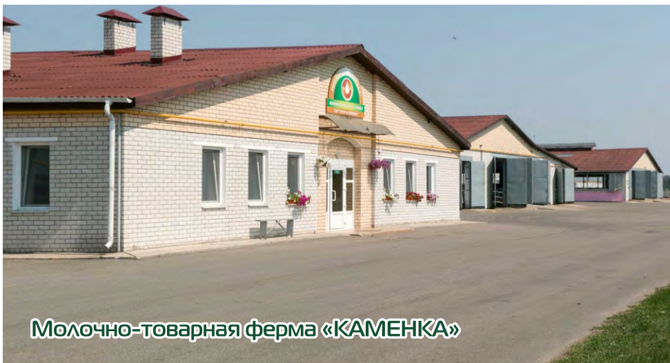
Молочно-товарная ферма «КАМЕНКА»

Высокая оценка всему коллективу СПУ «Протасовщина» была так же дана представителями районной вертикали власти на районных «Дожинках 2015» в г.Щучин 12 ноября. Решением Щучинского районного исполнительного комитета