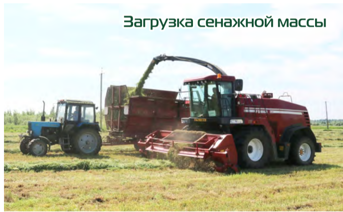
Загрузка сенажной массы

Конон Николай Иосифович, водитель транспортных средств, осуществлявших перевозку зерна от комбайнов, марка автотранспортного средства ЗИЛ 554, фактическое количество перевезенного зерна - 1493,2 тонн, условное количество перевезенного зерна - 3683,7 тонн;