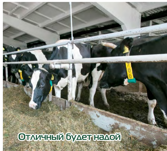
Отличный бюджет надой

коллективу СПУ «Протасовщина» присуждено первое место среди трудовых коллективов района по уборке урожая зерновых и зернобобовых культур в 2015 году и третье место по заготовке кормов.